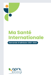
IHR VERSICHERUNGSLEITFADEN, DER DIE FUNKTIONSWEISE DES VERSICHERUNGSSCHUTZES ZUSAMMENFAST UND ALLE NÜTZLICHEN KONTAKTE ANGIBT